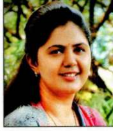
मा.ना.श्रीमती पंकजा गोपीनाथ मुंडे मंत्री, महिला व बाल विकास