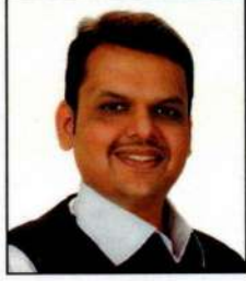
मा.ना.श्री. देवेन्द्र फडणवीस मुख्यमंत्री, महाराष्ट्र राज्य